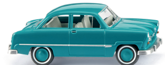
0821 48 Ford Taunus 12M Mit der Weltkugel an der Haubenspitze auf Tour 1952-55