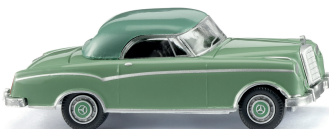
0144 22 MB 220 Coupé Wohlstands-Coupé im beginnenden Wirtschaftswunder 1956-60