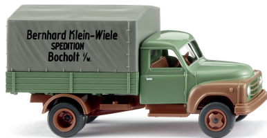
0345 06 Pritschen-Lkw (Hanomag L 28) Schnellaster mit Bocholter Speditionsgeschichte 1955-60