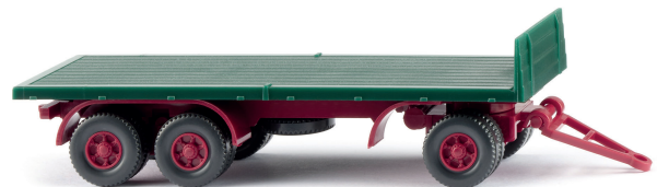
0447 02 Flachpritschen-Anhänger Formenneuheit für individuelle Gespanne mit Ladeflexibilität 1962-78