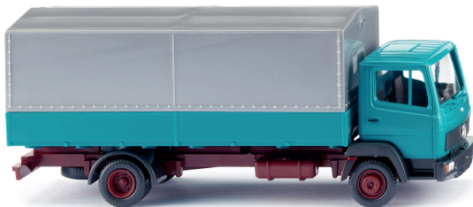
0431 21 Pritschen-Lkw (MB LP 814) Erfolgreicher Newcomer der 1980er-Jahre 1984-98