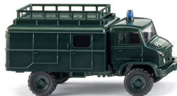
0360 03 Polizei - Unimog S 404 Bereitschaftspolizei im Spezialeinsatz 1955-80