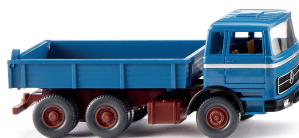
0424 07 Flachpritschenkipper (MB)