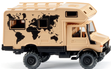
0375 03 Unimog U 1700 L Allrad-Kraftprotz für Dünen und Urwald 1975-93